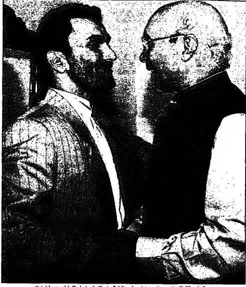
وزير الخارجية الأفغاني عبد الحميد عزيز (يمين) يستقبل السفير الإيراني في إسلام آباد محمد الخرمزانه (يسار) في مقره في كابول.

إسلام آباد - كابول - طهران - وكالاته أعلنت وكالة المخابرات الأمريكية الخاصة القريبة من حركة طالبان والتي تدير من باكستان أن مقاتلي طالبان استولوا على مدينة حواتان الواقعة على الحدود بين أفغانستان واوزبكستان. وقال المتحدث باسم طالبان عبد الله عبد الله في بيان صحفي إن قوات طالبان قد اقتطعت هذه المنطقة الاستراتيجية على الحدود مع أوزبكستان والتي تقع على بعد 60 كيلومترا عن الحدود مع أوزبكستان. وقال المتحدث باسم طالبان عبد الله عبد الله في بيان صحفي إن قوات طالبان قد اقتطعت هذه المنطقة الاستراتيجية على الحدود مع أوزبكستان والتي تقع على بعد 60 كيلومترا عن الحدود مع أوزبكستان. وقال المتحدث باسم طالبان عبد الله عبد الله في بيان صحفي إن قوات طالبان قد اقتطعت هذه المنطقة الاستراتيجية على الحدود مع أوزبكستان والتي تقع على بعد 60 كيلومترا عن الحدود مع أوزبكستان.